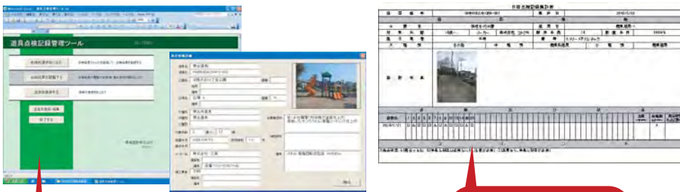
遊具点検記録管理ツール起動画面